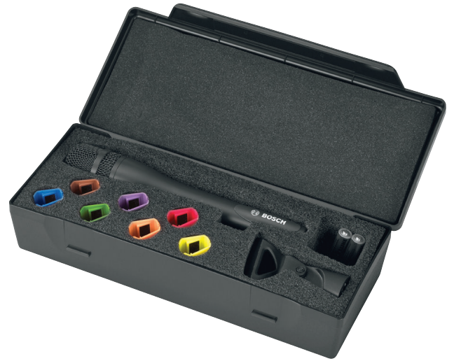
保护盒，内含无线、手持话筒以及附件